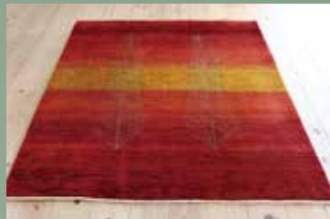
【5】 太陽の通り道 193×152 サフ 印象的な二本の木と黄色がお部屋のスパイスに