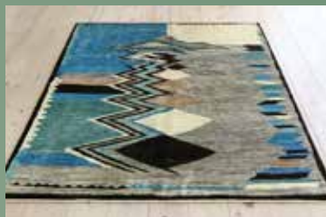
【2】 空を旅する者 197×151 ジャマール アート性の高いダイナミックな図柄で格好良く