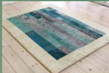
【8】 夜の終わり 202×152 サフ 少しずつ明るくなり始めた空のような優しい色合い