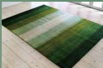
【3】 一本道を行けば 236×167 サフ 広大な草原を歩いているような爽やかなグリーン