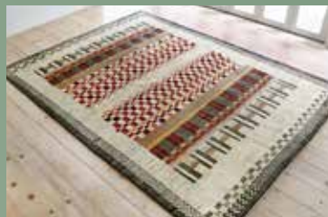
【1】 宮殿 287×203 サフ シックな図柄と配色でモダンな空間に