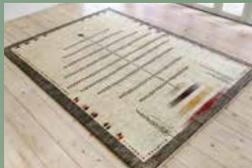
【6】 紡ぎ 245×174 サフ ふかふかと柔らかい原毛で紡がれた癒しの1枚