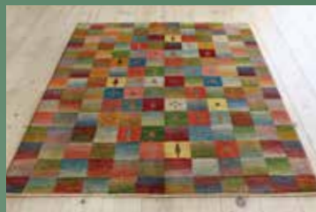
【4】 種々の贈り物 209×147 ジャマール 大地に芽吹き力強い植物達を1枚に表現