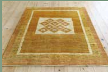
【7】 豊稔の祈り 210×153 サフ 爽やかな大地のような温もり溢れるイエロー